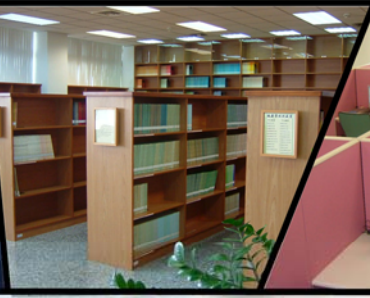
魏慶榮紀念圖書館